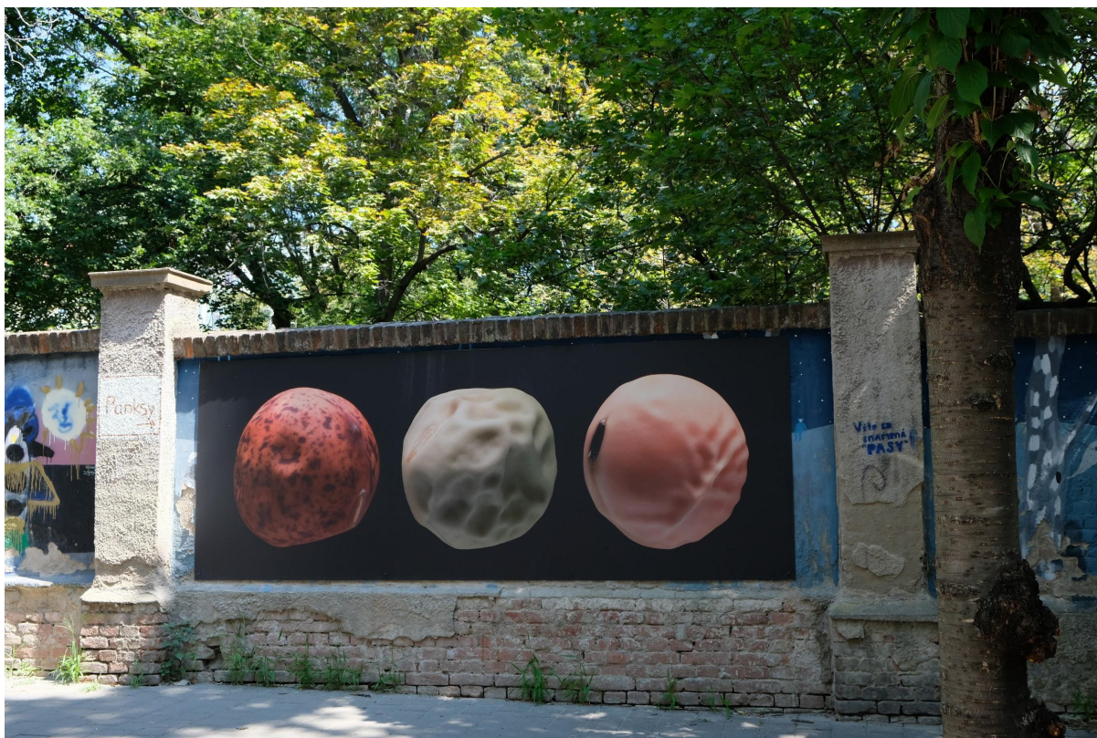
BAO 2022

Napriek transformáciám či prechodným krízam je množstvo projektov s nápaditými charaktermi jednotlivých prístupov ich iniciátorov. Brniansku off-space či mimo inštitucionálnu scénu je možno popísať ako dynamickú a umelecky i tematicky rôznorodú. Taktiež ju možno charakterizovať projektmi orientovanými na udalosti „tady a teď“, silné osobnosti umelcov/kýň vystupujúcich v roli kurátorov, hlavne v minulosti, a ich nadväznosť na brniansku FaVU. 7