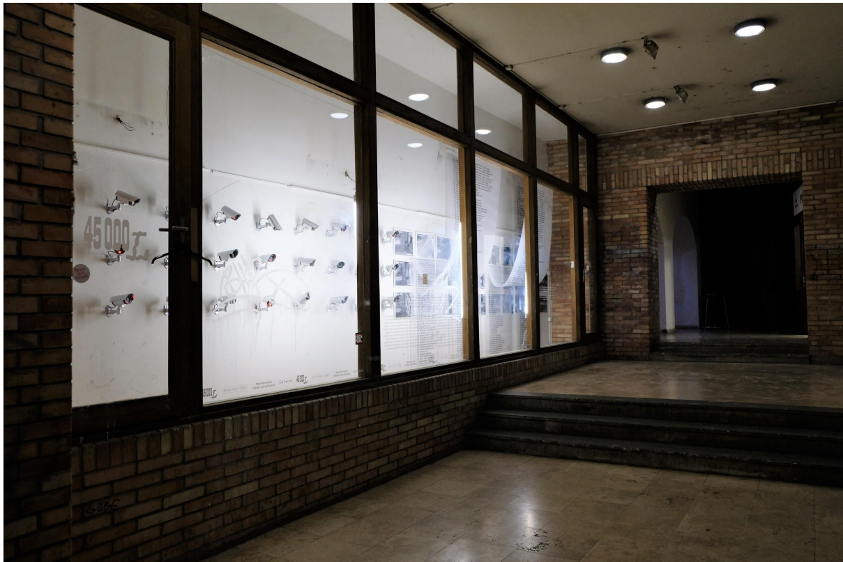
Galerie 45000L

Aj po výskume venujúcom sa spomenutým projektom však pokračuje záujem, poväčšine mladých umelcov/kýň a teoretikov/čiek, o rozširovanie činností sprostredkujúcich umenie na netradičných miestach. Dokladá to vznik ďalšej vitrínovej galérie, s názvom 45 000I, pod správou Fakulty architektury VUT. O záujme rozširovať výstavné priestory za hranice mestského centra svedčí taktiež založenie galérie Sibír, v postupne oživovanom staršom kultúrnom centre či výstavné a audiovizuálne realizácie v priestore Industra Art.