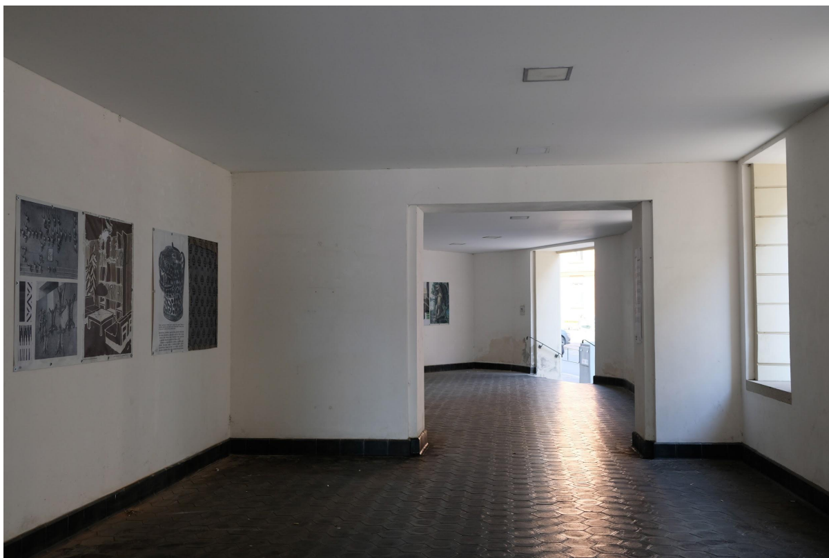
Galerie Průchod