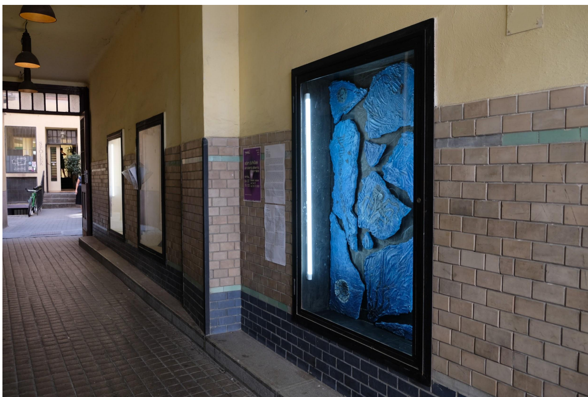
Postpost gallery, foto Viktoria Pardovičová